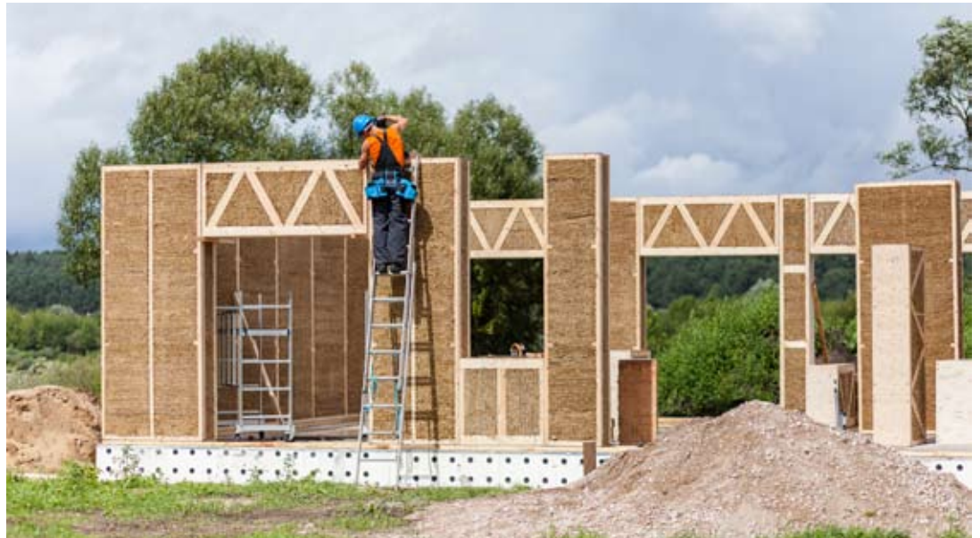
Et vinduesoverligger-kassette trækkes på plads, og vindspærren er ved at blive monteret til højre i billedet. Friland, Danmark.