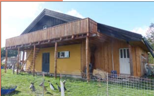
Fra idé til færdigt hus