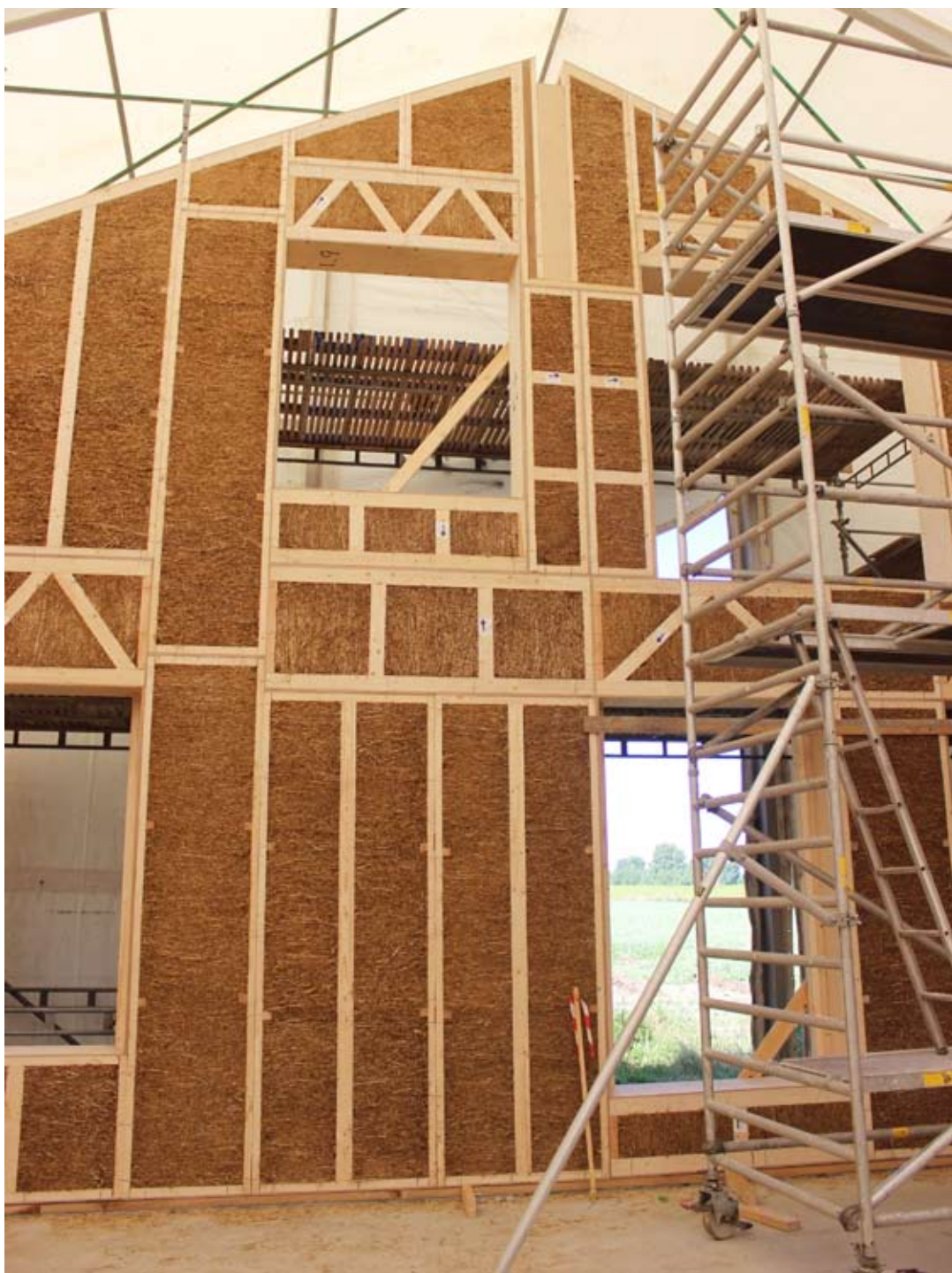
Gavl på Skolen for Livet, Møn.